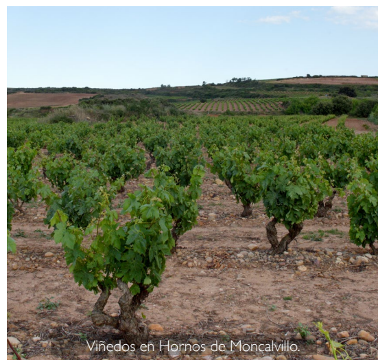
Viñedos en Hornos de Moncalvillo.

Cereza intenso borde violáceo. Fragante y juvenil, con aromas de violeta y frutillos rojos silvestres sobre un fondo tostado con toques de caramelo de fresa y regaliz rojo. En boca sigue mandando el carácter primario y frutal con abundantes recuerdos de bayas y maceración. Este tinto directo y fresco tiene el empuje suficiente para acompañar guisos de legumbres o animar cualquier barbacoa.